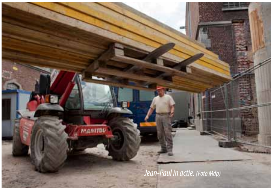
Jean-Paul in actie.

Jean-Paul blijkt overigens een verwoed visser te zijn. “Jacht en visvangst zijn mijn hobby's. Rudi is ook jager maar ook een goed springruiter.”