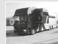
MERCEDES "ACTROS" 25-41